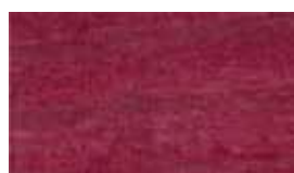
3205 Винный цвет