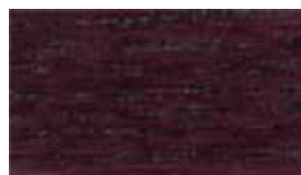
6333 Красный венге